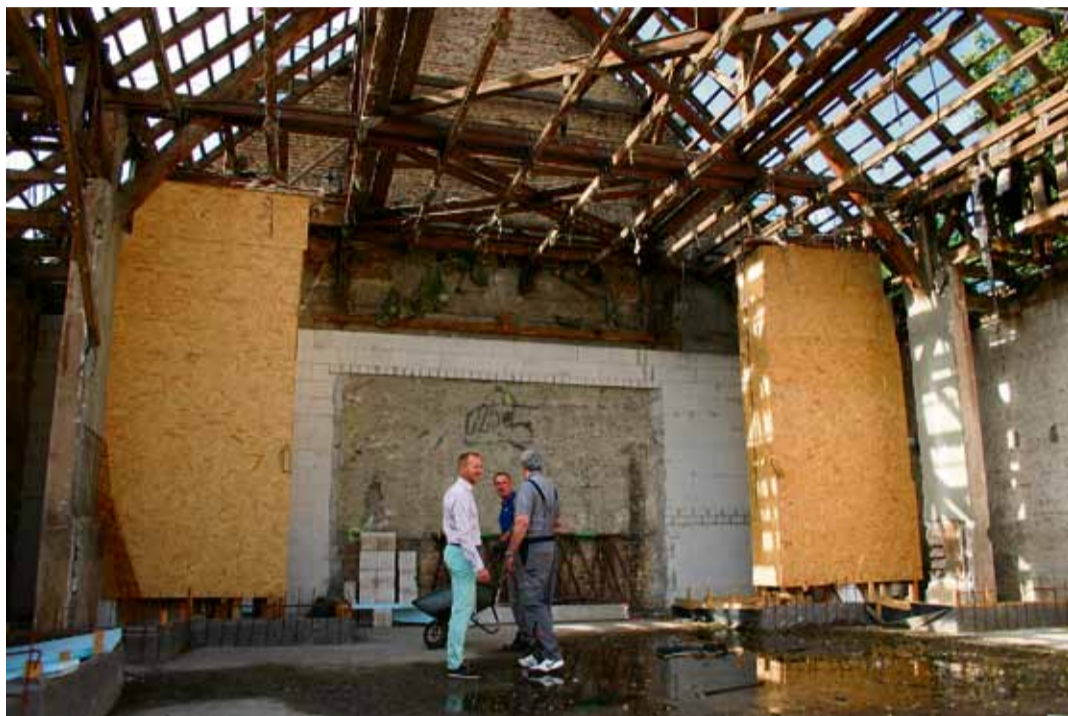
Blick in den entkernten Kinosaal in Richtung Bühne, die nach dem Umbau dort wieder ihren Platz finden soll.

rückgehalten. Auch die vorgefundene Vorführtechnik inklusive einiger Filme könne später für Dekorationszwecke genutzt werden, um an die Ursprüngliche Nutzung als Lichtspieltheater zu erinnern. Die Zusammenarbeit mit der Denkmalbehörde klappte gut, erwähnt Franell. Obwohl sich nicht alles umsetzen lassen werde, was man dort wünsche, bleibe man im Gespräch. So raten Fachleute davon ab, die von Fassadenkletterern