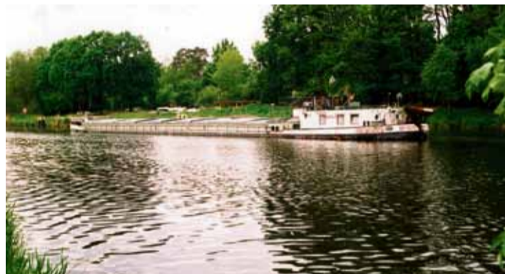
... und morgen eine weitere Brücke über den Teltowkanal?

Ausgangspunkte dabei sind die parallel zum Teltowkanal verlaufenden Siedlungsbänder, der Kanal mit begleitenden Wegen sowie die Verbindungen