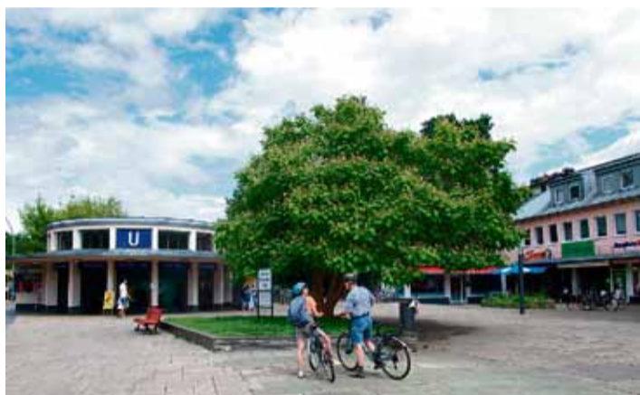
Der Vorplatz heute ...