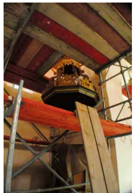
Decke und Wände haben ihren neuen, im Farbton leicht veränderten Anstrich erhalten. Die Gerüste werden abgebaut.

nommen, wo informiert, gegessen und ausgetauscht wird. Dieses Jahr waren es die Teltower Diakonischen Werkstätten, die Kirche in Güterfelde und das historisch nicht minder bedeutende Gotteshaus in Güterfelde, die den Austausch über ihr Gemeindeleben pflegten. Die erfolgreiche Veranstaltung ruft nach Wiederholung mit anderen Zielen. Wer beim Rundgang auf der Kunstmeile Einkehr nimmt im kühlen Kirchenschiff, wird womöglich vom Vorsitzenden und früheren Pfarrer Burkhardt Petzold ganz unaufdringlich in die Architektur- und Kunstge-