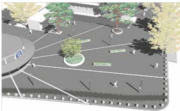
... und morgen.