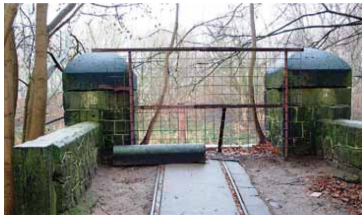
Heute alte Brückenreste ...und morgen?

Verlängerung der Sachtlebener Straße entlang der Nord-Süd-Verbindung beidseitig des Kanals eine städtebauliche Erweiterung erfolgen, welche die baulichen denkmalgeschützten Fragmente der Teltow-Werft auf Zehlendorfer Seite mit einbezieht. Im Entwurf soll von einer neuen Brücke über den Teltowkanal für den unmotorisierten Verkehr ausgegangen werden, die jedoch Teil einer neuen Achse im öffentlichen Personenverkehr werden könnte. Das Ziel ist eine geschickte Mischung von Wohnen in unterschiedlichen Wohnformen und Arbeiten. Für eine zukünftige Verknüpfung der Siedlungsgebiete Teltow und Zehlendorf liegt der Ausgangspunkt im Industriegebiet in Lichterfelde südlich der Goerzallee. Die Erschließung beider Seiten könnte eine Aufwertung des dortigen Grünraumes und eine neu zu denkende ressourcenschonende industriell-gewerbliche Nutzung zur Folge haben. – Beispielsweise als Recyclinghof mit angeschlossenen Werkstätten für Upcycling-Projekte oder als Reparatur-Werft für alte Boote am Stichkanal.