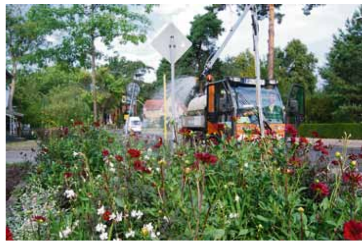
Die Bauhof-Mitarbeiter ließen es täglich ausgiebig regnen.