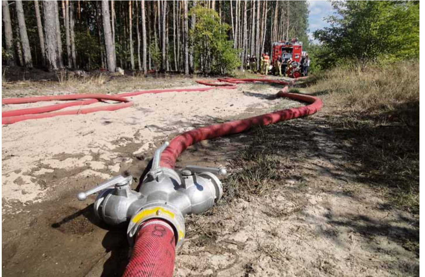
Über fünf Stunden waren die Kameraden der Wache Teltow und freiwilliger Wehren aus der Region beim Waldbrand im Teltower Ortsteil Ruhlsdorf im Einsatz.

Hitze verlangte nicht nur Einsatzkräften alles ab