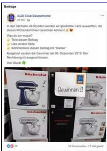
Ein Sonderangebot, das nur für wenige Tage oder Stunden bei Aldi

Aldi ist ein großes und in den Augen fast aller Deutschen besonders seriöses Unternehmen. Bei Aldi-Angeboten horchen viele auf, nicht selten gibt es echte Schnäppchen bei dem Discounter-Riesen. Es ist regelrecht naheliegend, dass sich Cyber-Kriminelle des Namens, des Logos und des Geschäftsprinzips von Aldi bedienen, es kopieren und für die eigenen kriminellen Zwecke missbrauchen.